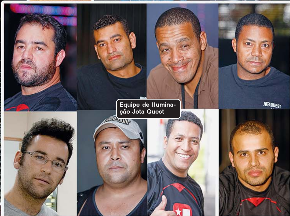
Equipe de Iluminação Jota Quest